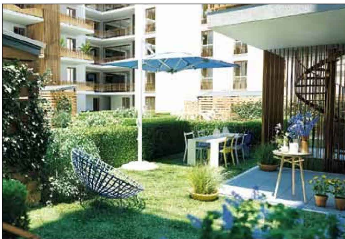
Privatgärten im Erdgeschoss

einheiten sowie drei Geschäften. Die Wohneinheiten teilen sich in 85 Miet- und 67 Eigentumswohnungen auf. Die beiden Bauteile ergeben nach der Fertigstellung ein fast geschlossenes Viereck. In der Mitte des Projekts „Henrix“ bildet sich so ein geschützter Hof, der für Terrassen, Spielplatz, Begrünung sowie für fußläufige Zugänge genutzt wird. Unter dem Hof und den Baukörpern soll mit zwei Tiefgeschossen die gemeinsam