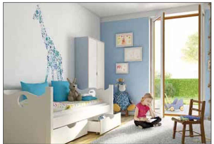
Ruhig und familienfreundlich